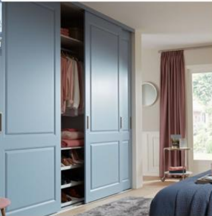
Kasten op maat

Poeldijk 13 3621 CZ Breukelen Telefoon 0346-251981 www.delangebreukelen.nl