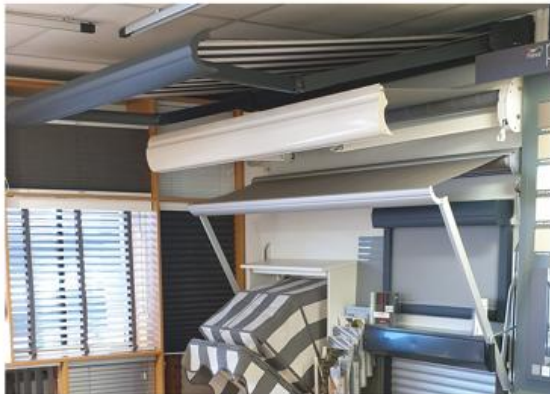
Binnen- en buitenzonwering