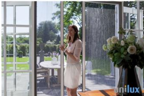
Raam- en deurhorren